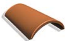
2 Коньковая черепица