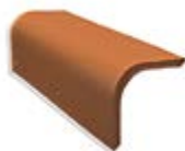
3 Торцевая черепица